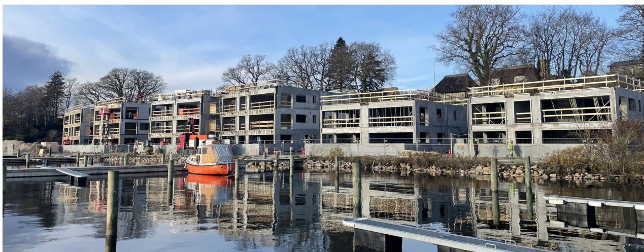
ThurinerHusene ved Svendborg ca. 4.800 kvm.

Længere mod vest i Vejle bød 1. kvartal ligeledes på store nyheder, da NPV indgik en joint venture-aftale med AkademikerPension om etape 1 i GAMMELHAVN. Joint venture-aftalen er etableret med parterne som 50/50 ejere af GAMMELHAVN-projektets første etape, der omfatter tre boligkarreer med et samlet areal på 16.000 kvm fordelt på 63 ejerboliger, 100 lejeboliger samt 5 butiks-/F&B-lejemål. Første etape omfatter tillige etableringen af den del af GAMMELHAVNs nye, offentlige bypark, som afgrænses af de tre boligkarreer, hvilket udgør 4.000 kvm af byparkens samlede areal på 9.000 kvm. JCN Bolig er totalentreprenør på etape 1 i GAMMELHAVN , og det har været glædeligt for alle parter at iagttage opførelsen af de tre første ejendomme i løbet af året.