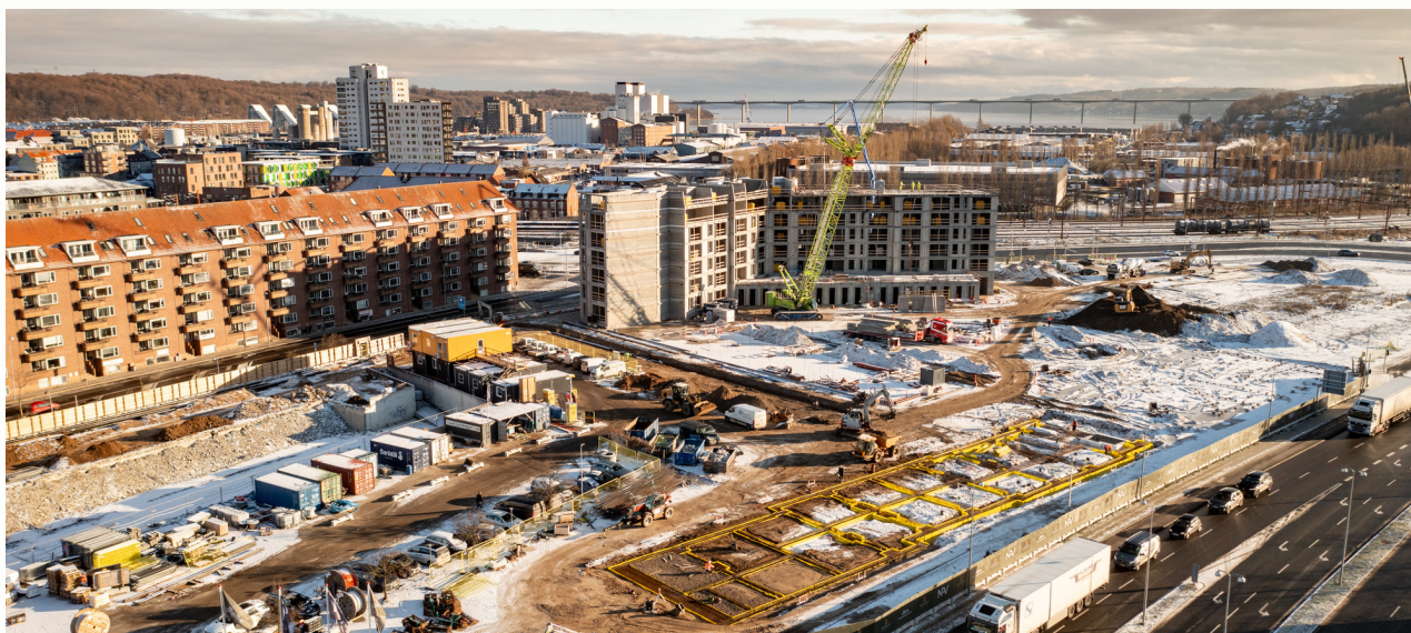
GAMMELHAVN i Vejle ca. 82.000 kvm.