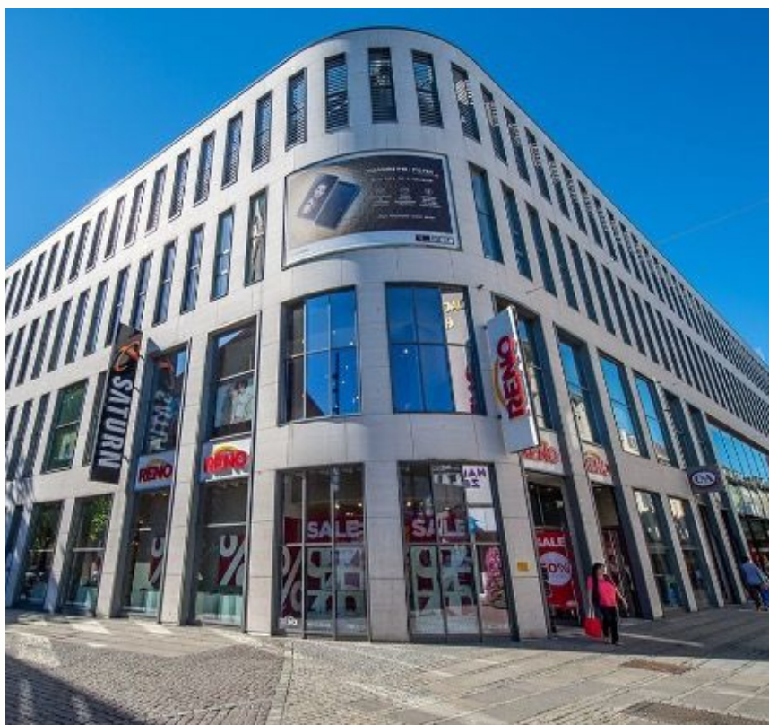
Nordlicht Kiel i Tyskland 44.500 kvm.