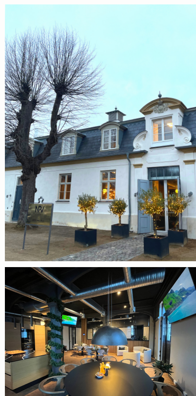
NPV's domicil i Charlottenlund.